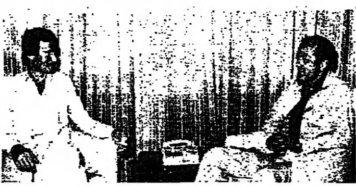
الرئيس الأسد يتحدث مع وفد من النبطية مع السيد الجبل الأحمر

ويعتبر ان الجبهة الوطنية المحافظة على الجنوب ينبغي ان تتخذ تدبيرا موعدا لاقباله الرئيسي الأسد ، ويتوقع ان يتم ذلك خلال هذا الأسبوع .